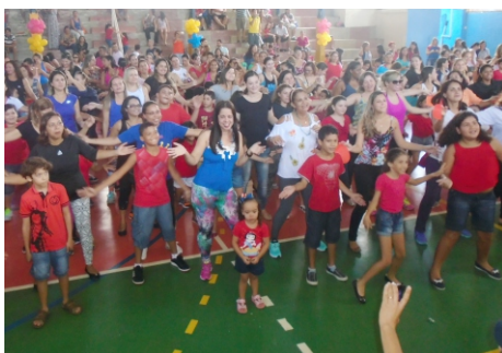
Comemoração Dia das Mães