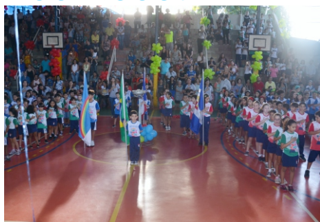
Abertura Jogos | Ed. Infantil/Fund. I